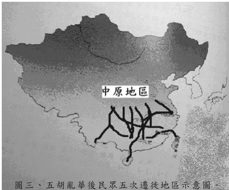
圖三、五胡亂華後民眾五次遷徙地區示意圖。

上述基因說與父系嫡傳論，作為定斷客家族群之一脈相傳性，在意識型態上本無交集，如授予客家人是一「現代中原客家族群」，似應較無爭議；況且百越族群，也是中原漢族形成因子之一，無關褒貶或榮辱。